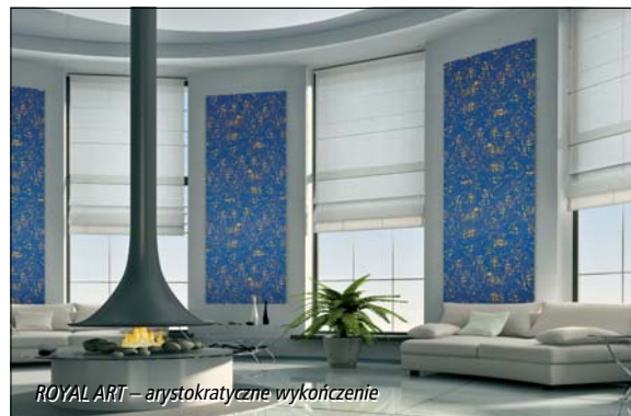
ROYAL ART – arystokratyczne wykończenie