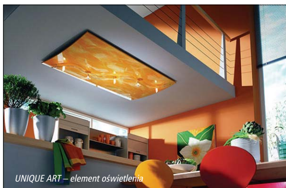
UNIQUE ART – element oświetlenia