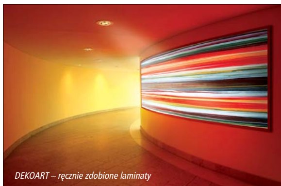
DEKOART – ręcznie zdobione laminaty

ANTIQUÉ – miedź – ten najcieplejszy z metali ciągle świeci żywym blaskiem. Klasyka oparta na ośmiu wzorach znajduje z pewnością swe miejsce we wnętrzach o charakterze rustykalnym i będzie stanowiła o jego wyjątkowości. Kominki – tak obecnie popularne – wydają się idealnym miejscem do wkomponowania tego wiecznie żywego metalu.