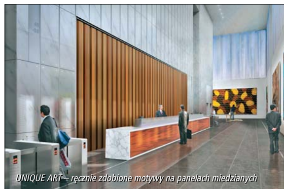
UNIQUE ART – ręcznie zdobione motywy na panelach miedzianych