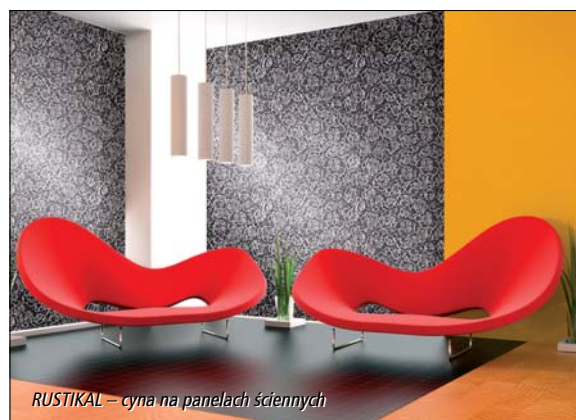
RUSTIKAL – cyna na panelach ściennych