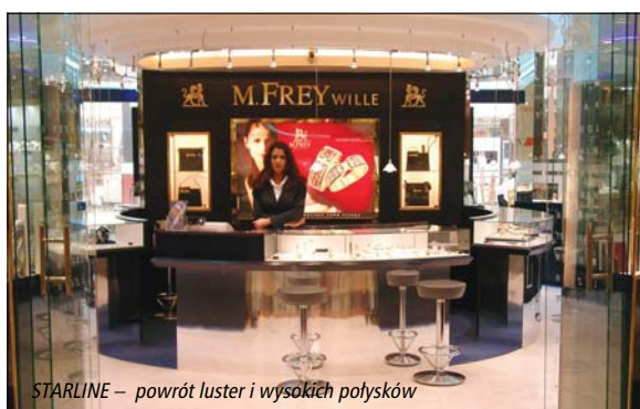
STARLINE – powrót luster i wysokich połysków