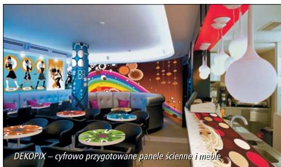
DEKOPIX – cyfrowo przygotowane panele ścienne i meble