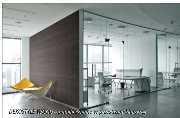
DEKOSTYLE WOOD – panele ścienne w przestrzeni biurowej