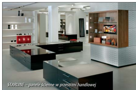
STARLINE – panele ścienne w przestrzeni handlowej