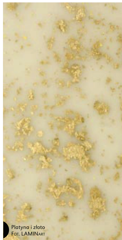
Platyna i złoto