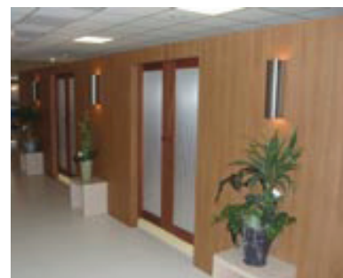
Starlux drzwi

Typowe zastosowanie DEKOLUX to podświetlone ścianki działowe, sufit, fronty lad recepcyjnych, panele ścienne i inne elementy systemów oświetlenia wnętrza.