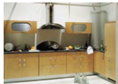
Starlux w kuchni