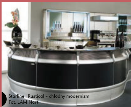
Starline i Rustical – chłodny modernizm

STARLINE – aluminium. Najpopularniejsze rozwiązania oparte na aluminium. Z uwagi na przystępne ceny aluminium oraz dużą „elastyczność wzorniczą” dekory oparte na tym metalu mogą znaleźć swe miejsce niemal w każdym wnętrzu. Na szczególne wyróżnienie zasługują z pewnością powracające do popularności trzy kolory luster (naturalne, tytan i złoto) oraz wzorniczo wiecznie młode aluminium szczotkowane, w tym wzory o zwiększonej odporności na zarysowania i uszkodzenia.