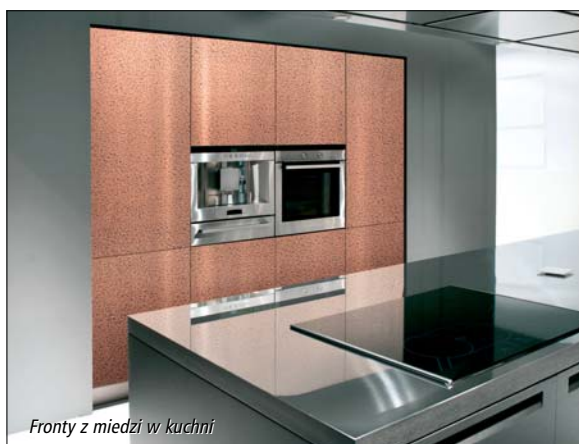
Fronty z miedzi w kuchni