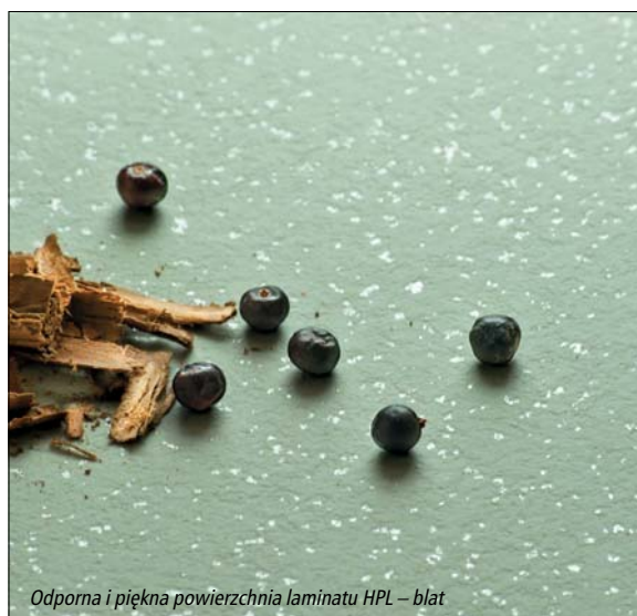
Odporna i piękna powierzchnia laminatu HPL – blat