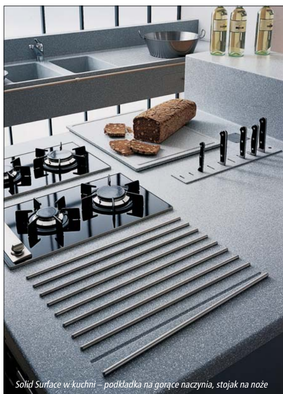
Solid Surface w kuchni – podkładka na gorące naczynia, stojak na noże