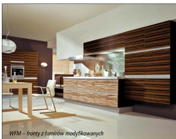
WFM – fronty z fornirów modyfikowanych