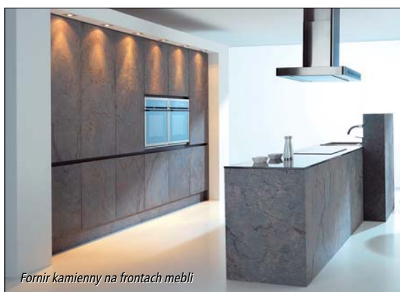
Fornir kamienny na frontach mebli