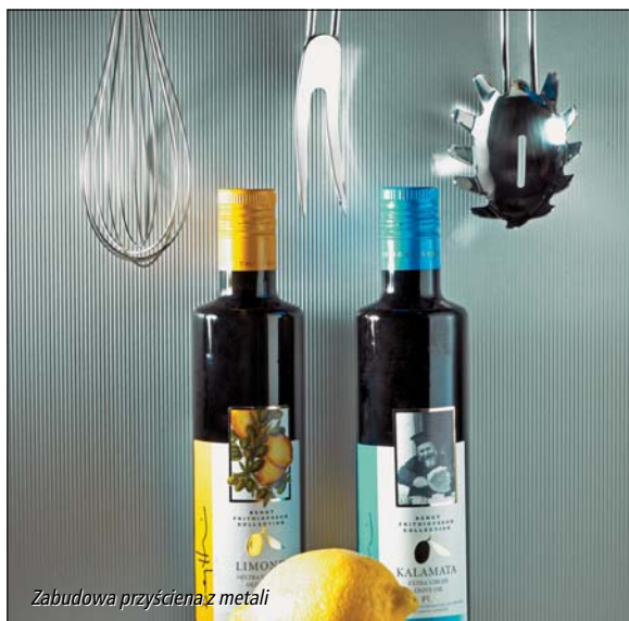
Zabudowa przyścienna z metalu

LAMINATY HPL – nasze propozycje w zakresie powierzchni roboczych z wysokociśnieniowych laminatów dekoracyjnych są z pewnością najobszerniejsze na polskim rynku. Dość powiedzieć, że oferujemy pełne oferty katalogowe trzech wiodących europejskich marek – włoskiej Arpy oraz niemieckich Resopal i Duropal, co w rezultacie pozwala na wybór z ponad tysiąca propozycji. Wybór wzoru wzbogacany jest o wiele kombinacji ze strukturami powierzchni (maty, połyski, struktury kamienne etc.) dodatkowo zwiększając i tak już wyjątkowo bogaty pakiet możliwości. Oczywiście wszystkie oferowane przez nas laminaty produkowane są zgodnie z polską normą PN 438, która reguluje szereg właściwości użytkowych laminatów wysokociśnieniowych. Dla porównania, często stosowane w tańszych blatach laminaty niskociśnieniowe, nie podlegają kontroli wymienionej normy, która reguluje przecież tak istotne dla użytkownika wartości jak odporność na zarysowania, temperaturę czy zaplamienia. Swoim partnerom oferujemy nie tylko laminat (czyli samą wierzchnią okleinę blatu) ale również wstęgi blatowe o różnych długościach i szerokościach. W wielu wypadkach komponując blat,